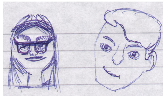
Alžběta I. a Jan Hus /Martin Soubusta, VII/