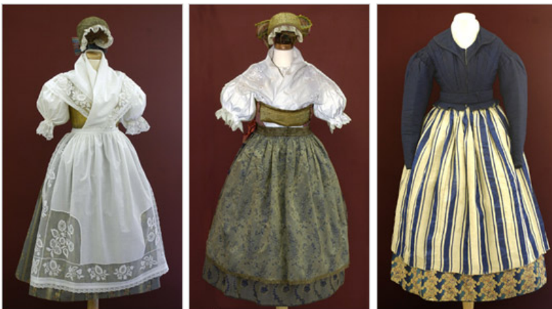
Zleva: Ruzyňský kroj, Mělnický kroj, Ženský oděv z Berounska