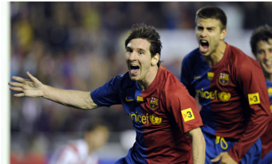
Lionel Messi (Barcelona)