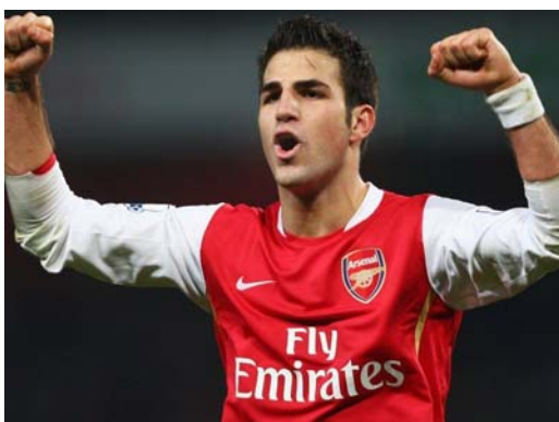
Cesc Fabregas (Arsenal)