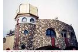
Die Markthalle mit ihrem Zirkelbau in Abovian