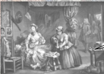
obraz se série Dráha prostitutky

Masové rozšíření kreslených seriálů bylo umožněno až vynálezem knihtisku. Už v roce 1460 vychází kreslené Utrpení svatého Erasma. Ve své době bylo velmi oblíbené. Možná i proto, že brutalitou si nezašlo s dnešní undergroundovou produkcí.