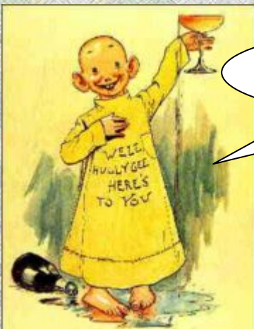
Žluté dítě, titulní postava prvního moderního comicsu

Dalším mezníkem byly příběhy William Hogartha, jehož série obrazů Dráha prostitutky (1731) a Dráha žhýralce , později přepracované na série rytin, patřily k nejpopulárnějším tiskům své doby. Ochrana práv autora byla popudem k vývoji copyrightu.